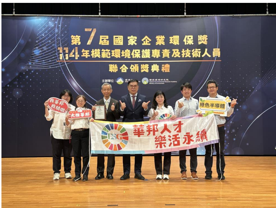
▲ 高雄廠獲 國家企業環保獎