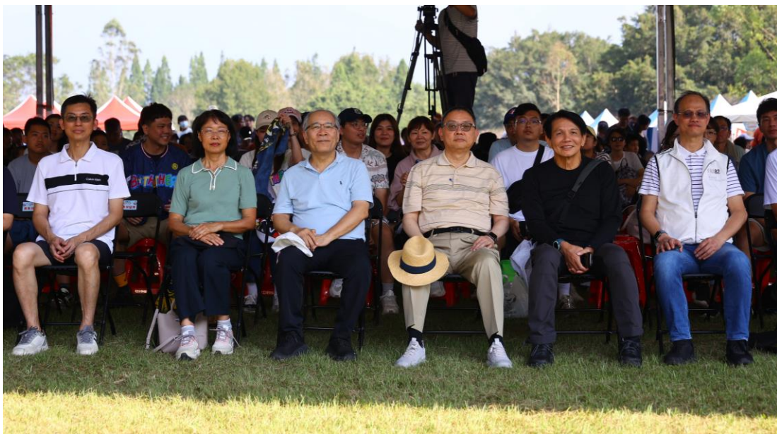
▲ 零碳家庭日媒體採訪活動