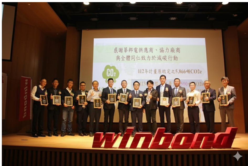
▲ 2025永續供應鏈管理論壇