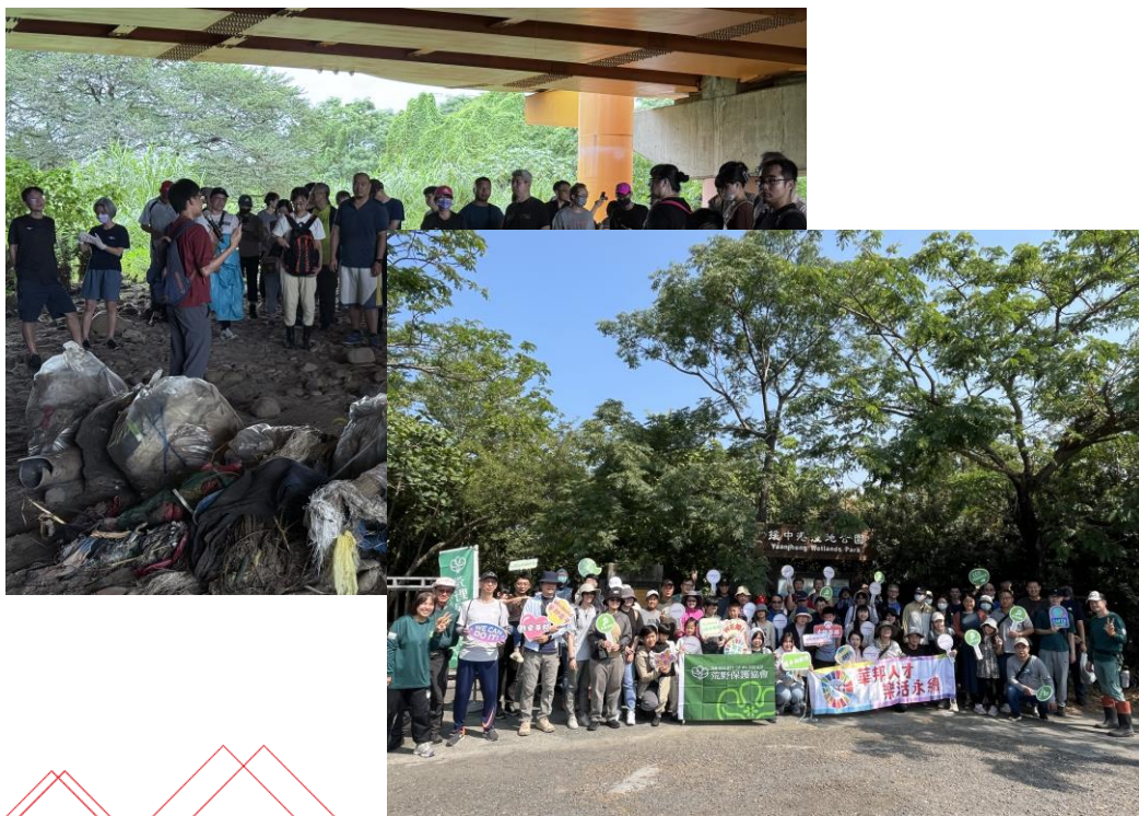
▲ 與荒野保護協會合作環境保育活動