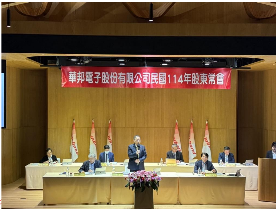
▲ 114年華邦電子股東常會